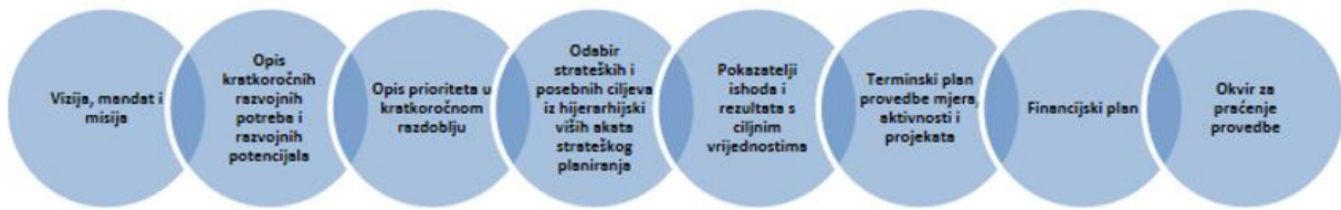
Slika 1. Obvezni sadržaj provedbenih programa JLPS