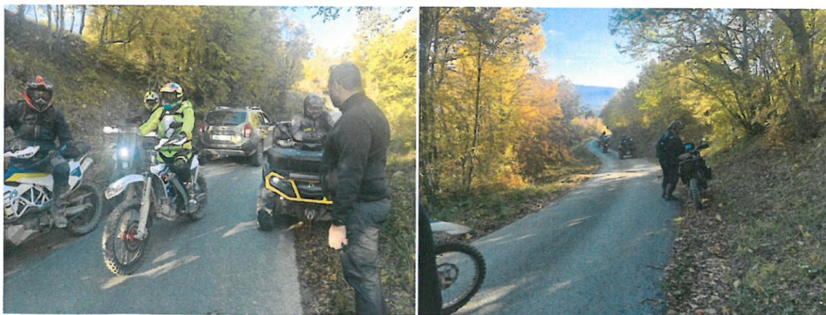
Razgovor s motoristima

Čuvari prirode tokom nadzora mjenjali su lokacije promatranja područja (Pićan, Gračišće, Staza Sv. Šimuna, Staza Sv. Roka, Slap Sopot i dr.)te do kraja radnog vremena nisu evidentirane nikakve radnje po pitanju vožnje motocikla zaštićenim područjem.