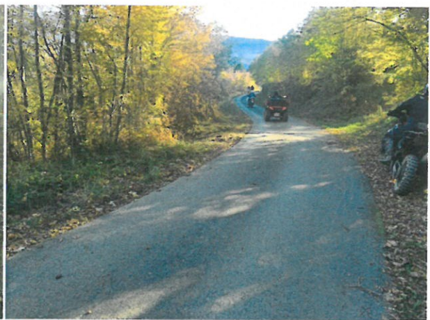
Odlazak ATV vozila