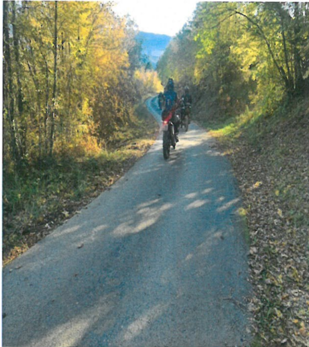
Odlazak ostatka grupe